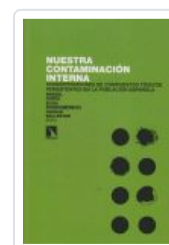
NUESTRA CONTAMINACION INTERNA PORTA, MIQUEL