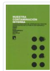
NUESTRA CONTAMINACION INTERNA PORTA, MIQUEL