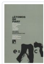
ATOMOS DE FIAR BENACH, JOAN