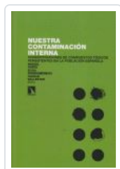
NUESTRA CONTAMINACIÓN INTERNA PORTA, MIQUEL