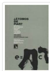
ATOMOS DE FIAR BENACH, JOAN