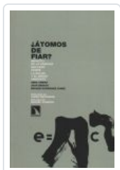
ATOMOS DE FIAR BENACH, JOAN