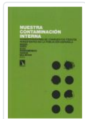
NUESTRA CONTAMINACIÓN INTERNA PORTA, MIQUEL