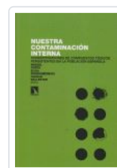
NUESTRA CONTAMINACION INTERNA PORTA, MIQUEL