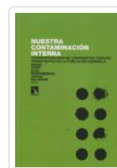
NUESTRA CONTAMINACION INTERNA PORTA, MIQUEL