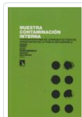
NUESTRA CONTAMINACION INTERNA PORTA, MIQUEL