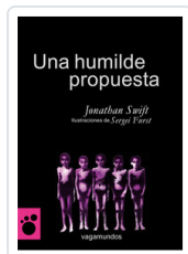
UNA HUMILDE PROPUESTA SWIFT, JONATHAN