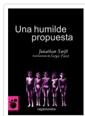
UNA HUMILDE PROPUESTA SWIFT, JONATHAN