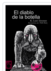
DIABLO DE LA BOTELLA STEVENSON, LOUIS