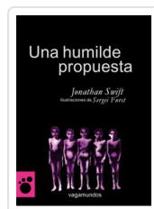
UNA HUMILDE PROPUESTA SWIFT, JONATHAN