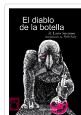
DIABLO DE LA BOTELLA STEVENSON, LOUIS