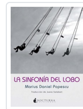
SINFONIA DEL LOBO, LA POPESCU, MARIUS