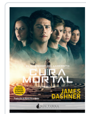
CORREDOR LABERINTO, 3 CURA MORTAL DASHNER, JAMES