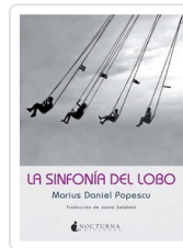
SINFONIA DEL LOBO, LA POPESCU, MARIUS