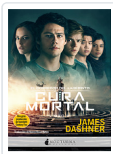
CORREDOR LABERINTO, 3 CURA MORTAL DASHNER, JAMES