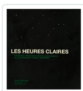
LES HEURES CLAIRES QUETGLAS, JOSEP