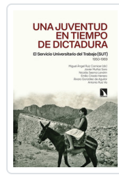
UNA JUVENTUD EN TIEMPOS DE DICTADURA AA.VV.