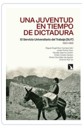
UNA JUVENTUD EN TIEMPOS DE DICTADURA AA.VV.