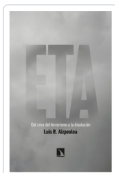
ETA. DEL CESE DEL TERRORISMO A LA DISOLUCIÓN AIZPELEA, LUIS R.