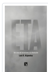
ETA. DEL CESE DEL TERRORISMO A LA DISOLUCIÓN AIZPEOLEA, LUIS R.