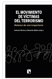
MOVIMIENTO DE VICTIMAS DEL TERRORISMO RIVERA /MATEO