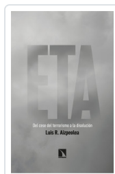
ETA. DEL CESE DEL TERRORISMO A LA DISOLUCIÓN AIZPEOLEA, LUIS R.