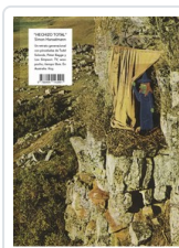
** HECHIZO TOTAL HANSELMANN, SIMON