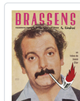
BRASSENS LA LIBERTAD SFAR, JOANN