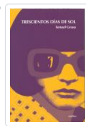
TRESCIENTOS DÍAS DE SOL GRASA, ISMAEL