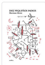
DIEZ PEQUEÑOS INDIOS SHERMAN, ALEXIE