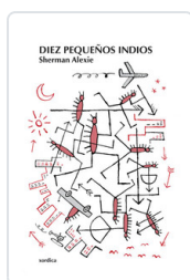
DIEZ PEQUEÑOS INDIOS SHERMAN, ALEXIE