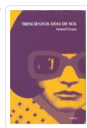
TRESCIENTOS DÍAS DE SOL GRASA, ISMAEL