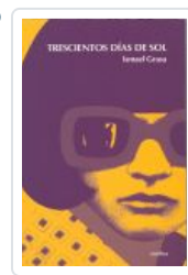
TRESCIENTOS DÍAS DE SOL GRASA, ISMAEL