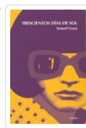
TRESCIENTOS DÍAS DE SOL GRASA, ISMAEL