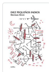
DIEZ PEQUEÑOS INDIOS INDIOS SHERMAN, ALEXIE