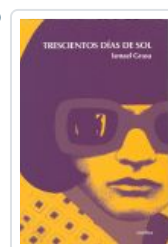
TRESCIENTOS DÍAS DE SOL GRASA, ISMAEL