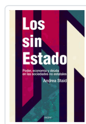
LOS SIN ESTADO STAID, ANDREA