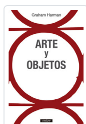
ARTE Y OBJETOS HARMAN, GRAHAM