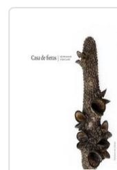
CASA DE FIERAS MONTEVERDE, JULIO