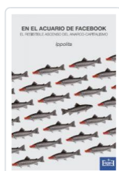
EN EL ACUARIO DE FACEBOOK IPPOLITA