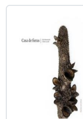
CASA DE FIERAS MONTEVERDE, JULIO