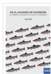
EN EL ACUARIO DE FACEBOOK EL REBELLENDIMIENTO EN EL ACUARIO DE FACEBOOK IPPOLITA