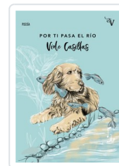
POR TI PASA EL RIO CASILLAS, VIOLE