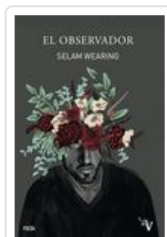
OBSERVADOR, EL WEARING, SELAM