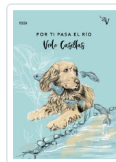
POR TI PASA EL RIO CASILLAS, VIOLE