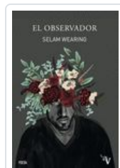
OBSERVADOR, EL WEARING, SELAM