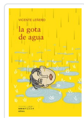
GOTA DE AGUA, LA LEÑERO, VICENTE