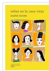
NIÑAS EN LA CASA VIEJA NOVAK, DAZRA