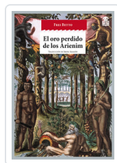
ORO PERDIDO DE LOS ARIENIM, EL BETTO, FREI