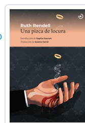
UNA PIZCA DE LOCURA RENDELL, RUTH