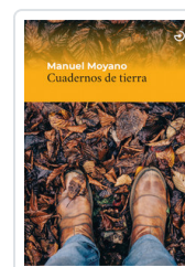
CUADERNOS DE TIERRA MOYANO, MANUEL