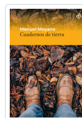
CUADERNOS DE TIERRA MOYANO, MANUEL