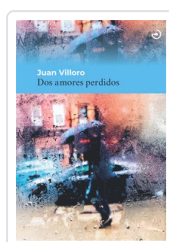
DOS AMORES PERDIDOS VILLORO, JUAN