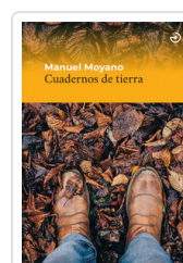
CUADERNOS DE TIERRA MOYANO, MANUEL