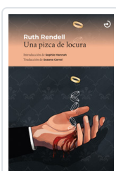
UNA PIZCA DE LOCURA RENDELL, RUTH