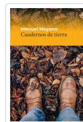
CUADERNOS DE TIERRA MOYANO, MANUEL