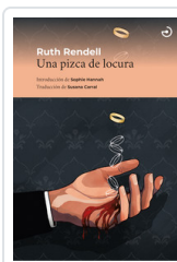
UNA PIZCA DE LOCURA RENDELL, RUTH