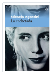
CACHETADA, LA AGOSTINI, MICAELA