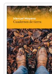
CUADERNOS DE TIERRA MOYANO, MANUEL