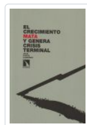
EL CRECIMIENTO MATA Y GENERA CRISIS TERMINAL GARCIA, JULIO