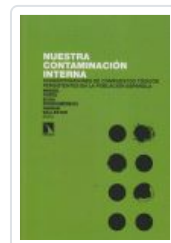
NUESTRA CONTAMINACION INTERNA PORTA, MIQUEL