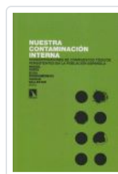
NUESTRA CONTAMINACION INTERNA PORTA, MIQUEL