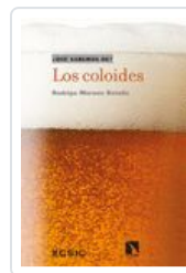
COLOIDES, LOS MORENO, RODRIGO