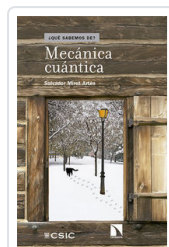
MECANICA CUANTICA MIRET, SALVADOR