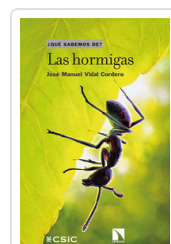
HORMIGAS, LAS VIDAL, JOSE MANUEL