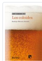
COLOIDES, LOS MORENO, RODRIGO