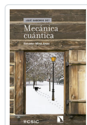
MECANICA CUANTICA MIRET, SALVADOR