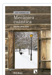
MECANICA CUANTICA MIRET, SALVADOR