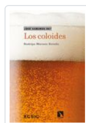
COLOIDES, LOS MORENO, RODRIGO