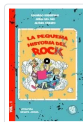
PEQUEÑA HISTORIA DE ROCK AA.VV.