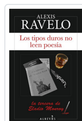
TIPOS DUROS NO LEEN POESÍA, LOS RAVELO, ALEXIS