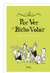
POR VER BICHO VOLAR