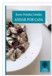
ANDAR POR CASA PENALTA, ROCIO