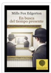
EN BUSCA DEL TIEMPO PRESENTE FOX, MILLS