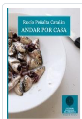
ANDAR POR CASA PEÑALTA, ROCIO