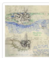
FERNANDO HIGUERAS. DESDE EL ORIGEN FUNDACION FERNANDO HIGUERAS