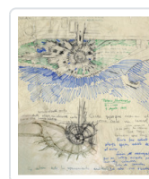
FERNANDO HIGUERAS. DESDE EL ORIGEN FUNDACION FERNANDO HIGUERAS