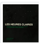
LES HEURES CLAIRES QUETGLAS, JOSEP